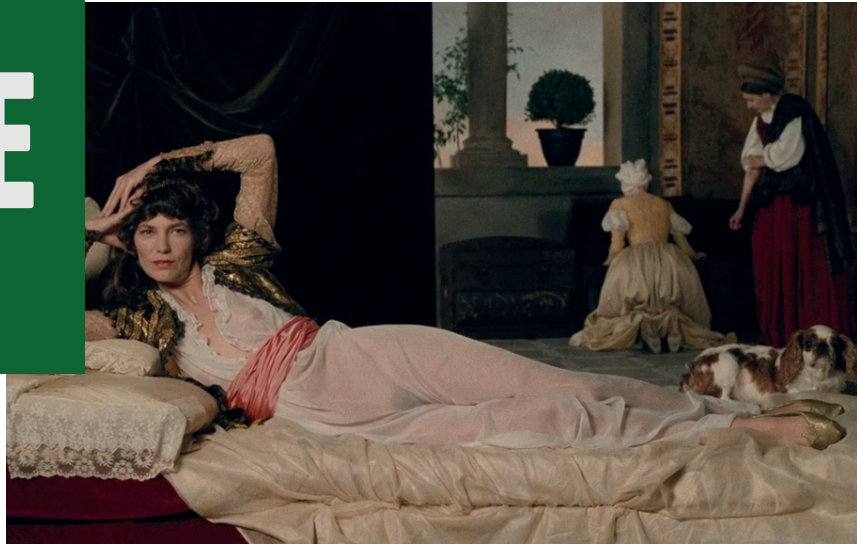
Jane B. par Agnès V. (Agnès Varda, 1987)